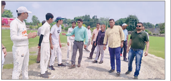
रोहतक। खिलाड़ियों का परिचय कराते आयोजक।