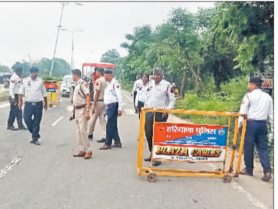
रोहतक। अभियान चलाकर जांच करते पुलिस अधिकारी।