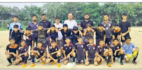
रोहतक। फुटबॉल प्रतियोगिता की विजेता टीम।

कई वर्षों से फुटबॉल खेल में रोहतक की टीम हर वर्ग में किसी न किसी स्तर पर प्रथम या द्वितीय स्थान प्राप्त करती रही